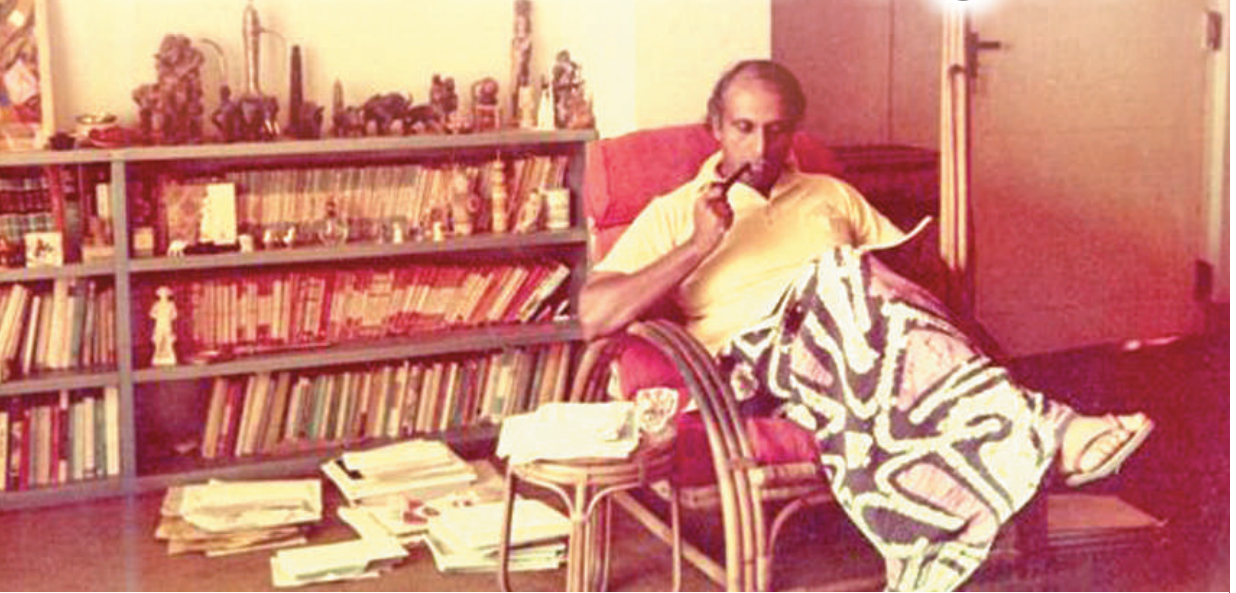
ආචාර්ය ගාමණී කොරයා 'හෝටන් ලොජ්' සිය නිවෙසේ විවේචනා සිටිමින් හේරාහේරා.

ආචාර්ය ගාමණී කොරයා මෙරට පුහුණු ගණනාවකට ලේ නැකම් ඇත්තෙකි. 1953 - 1956 දක්වා කොටේ අග්‍රාමාත්‍ය ධුරය දැරූ සර් ජෝන් කොතලාවල ඔහුගේ මාමා ය. එනම් සර් ජෝන්ගේ එකම සහෝදර, ආචාර්ය ගාමණී කොරයාගේ මව ශ්‍රීඩා ය. ඇය විවාහ වූයේ, වෛද්‍ය සිද්ධාර්ථ කොරයා සමඟ ය.