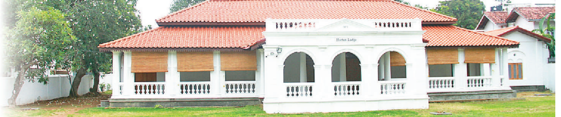
ආචාර්ය ගාමණී කොරයා ජීවත් වූ 'හෝටන් ලොජ්' නිවෙස ආගාර්ජය - දුෂ්මන්ග මාසයකදී

කො මුහුණුවීමේ ජනරජයේ දේ වෙනස් වී ඇතත්, අවුරුදු 148ක් තිස්සේ සියලු දෘෂිමත් 'Horton Lodge' නිවෙස තවමත් එලෙසම ය.